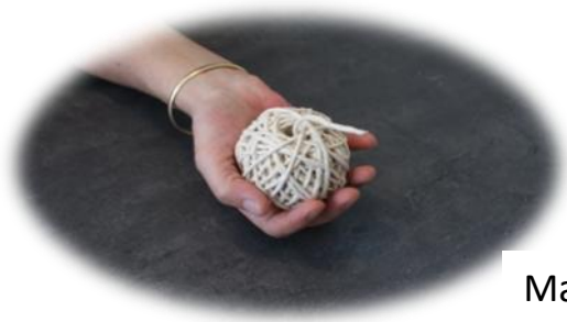
Ma pelote avec son fil qui dépasse....